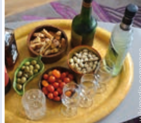
apéro virtuel – 11.01./14.03.