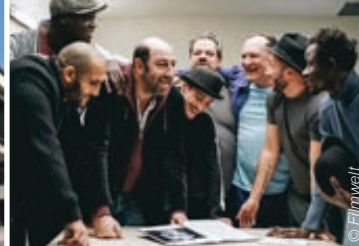
Un triomphe – 27./29.03.