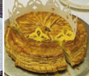
Galettes des rois – 25.01.