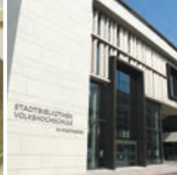
Grenzenlos – Nacht der Bibliotheken – 17.03.