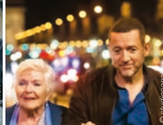
Une belle course – 24./26.04.