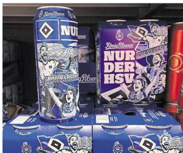
Eine Köpi-Edition gibt es bisher nur in Hamburg für die HSV-Fans. MSV-Anhänger hätten gern auch eine eigene.