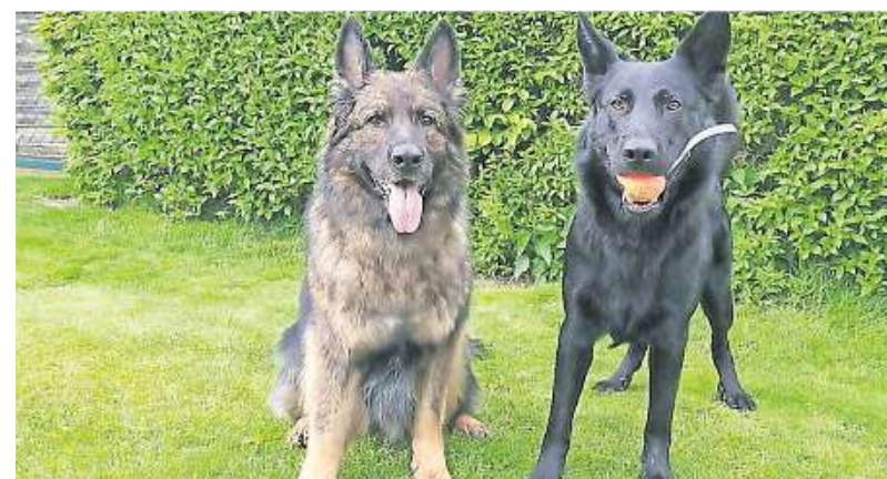
Auf die Zusammenarbeit mit Polizeihunden dürfen sich Interessenten freuen. In Duisburg werden entsprechende Tierpfleger gesucht.