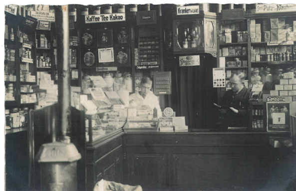
Zwischen 1877 und 1941 gab es in Duisburg mindestens 40 Kolonialwarenläden.

In Zusammenarbeit mit Exile e.V. wurde der digitale Audiowalk duisburg.colonialtracks.de erstellt. An sechs Audiostationen in der Innenstadt erfahrt ihr mehr über koloniale Spuren in Duisburg. Scant den QR-Code und los geht's!