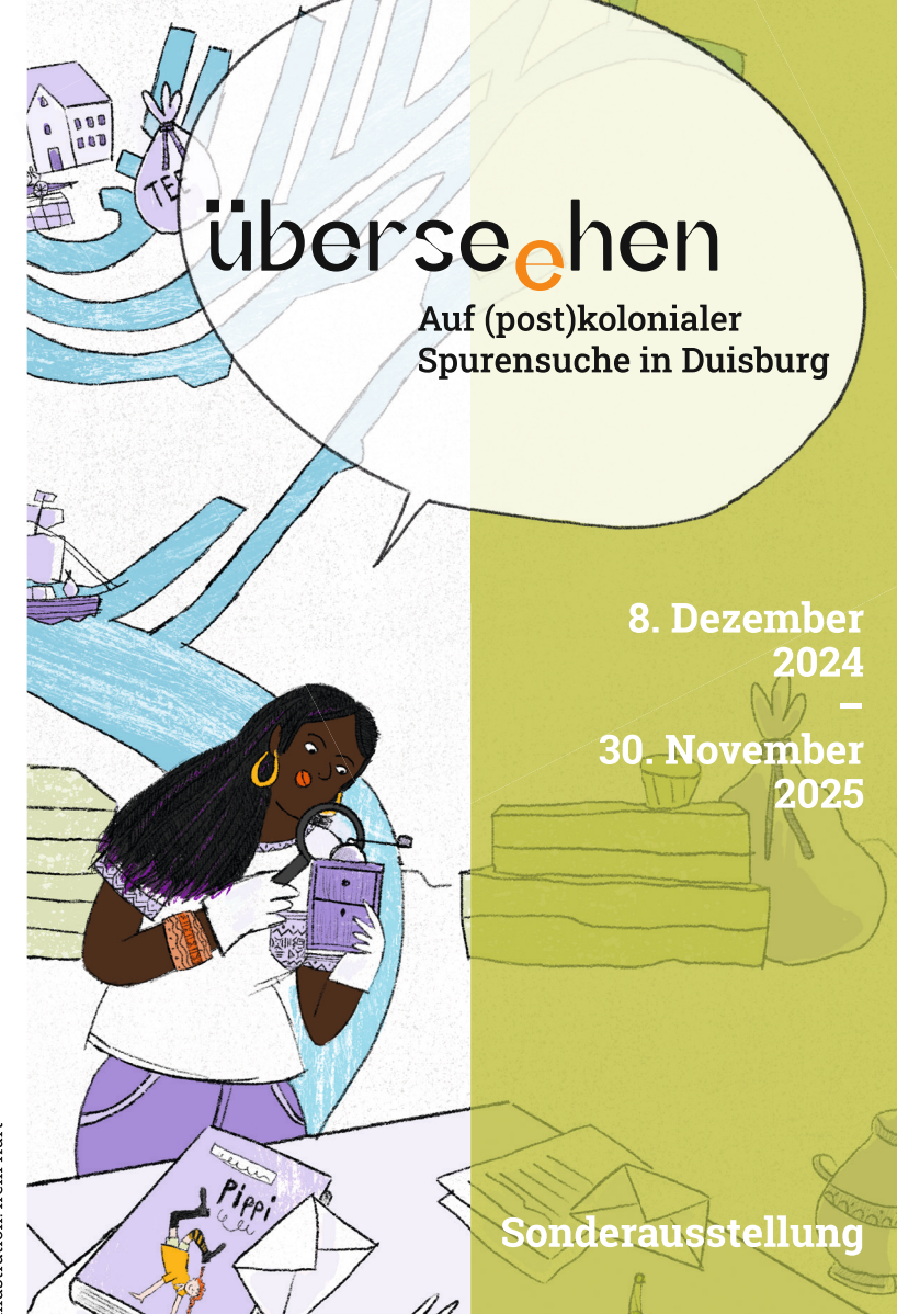
Illustration: Irem Kurt