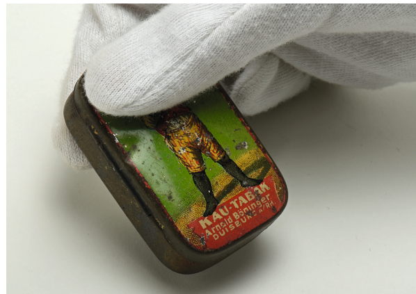
Rassistische Werbung prägte Vorurteile und verfestigte Stereotype; hier das Beispiel einer Tabakdose der Duisburger Firma Böninger.

Die beiden fiktiven Duisburgerinnen Mariam und Cema machen sich auf die Suche nach (post)kolonialen Spuren in Duisburg.