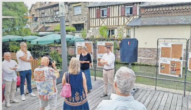
Der offizielle Akt: Jetzt heißt der Platz nach einem berühmten Krefelder.