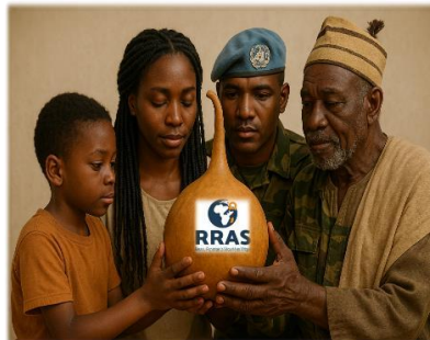
Photo: Offizielles Logo des Gandhi-Partners, Symbol für die RAS-Szenarien (AI generiert)