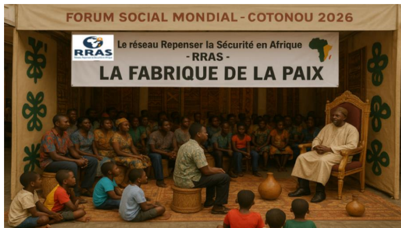
Photo: Modell eines Peace Scenario Treffens während WSF (KI generiert)

Das übergeordnete Ziel des WSF 2026 in Cotonou ist es, den Kampf gegen den neoliberalen, imperialistischen und patriarchalischen Kapitalismus zu unterstützen und zu stärken, indem lokale, faire und inklusive Regierungsführung, sozialer Zusammenhalt und Frieden wiederhergestellt werden. Das WSF, das 2001 erstmals in Porto Alegre (Brasilien) stattfand, wird erneut Tausende von Teilnehmer:innen und Delegierten sozialer Bewegungen, Arbeitnehmer:innen, Landwirt:innen, zivilgesellschaftlichen Institutionen und marginalisierten Gemeinschaften zusammenbringen. Soziale Bewegungen aus aller Welt sind aufgerufen, gemeinsam alternative Antworten auf kritische Herausforderungen wie Klimawandel, Frieden, Migration und soziale Gerechtigkeit zu entwickeln – in einer Welt, die von Gewalt, Hass, Kapitalismus, Imperialismus und Globalisierung geplagt ist.